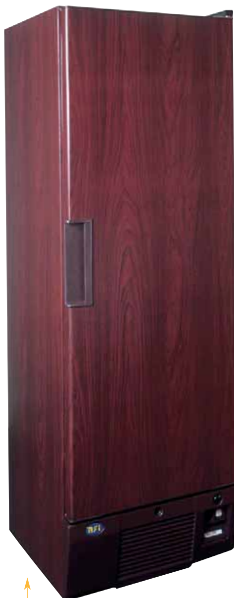
CV 360 Volle deur L 60 x D 63 x H 183 cm