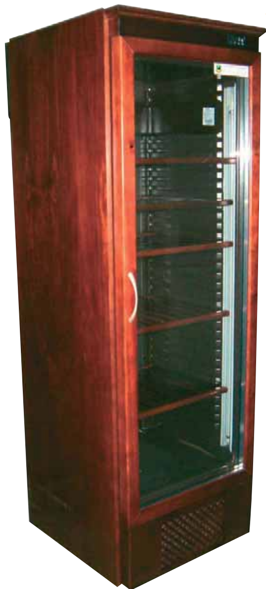
CV 360 LV Houten wijnkoeler 320 W L 62,5 x D 64 x H 190 cm